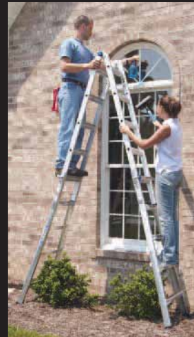
ESCALERA DE TIJERA DOBLE