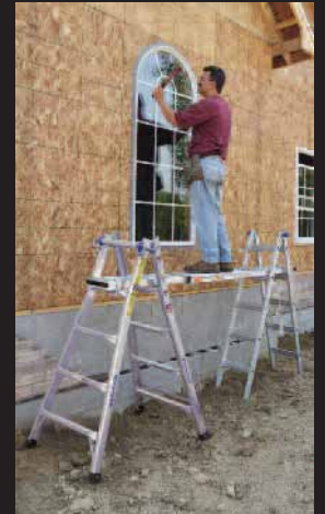
2 BASES DE ANDAMIO