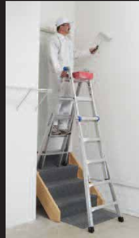
ESCALERA DE TIJERA AJUSTABLE